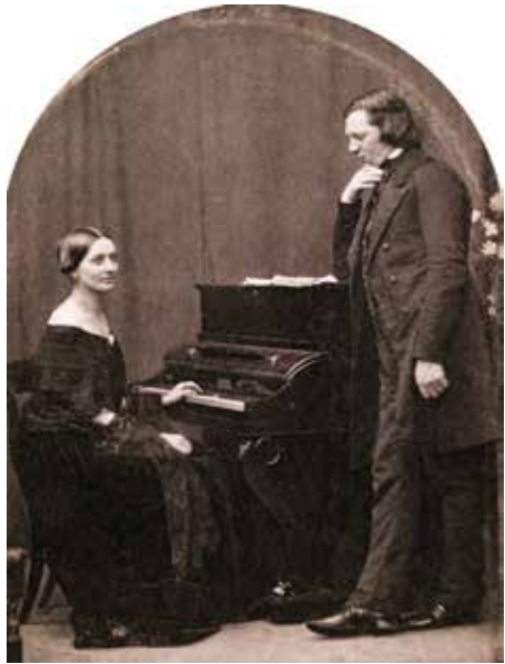
Clara und Robert Schumann, Daguerrotypie, um 1850

Brahms, Klavierkonzert Nr. 1 d-Moll. Monumental und von sinfonischem Geist geprägt erscheint Brahms' erstes Klavierkonzert wie ein Orchesterwerk mit obligatem Klavier. Der junge Komponist ließ sich vom Pathos Beethovens inspirieren und entfernte sich bewusst von einem reinen Virtuosenstück. Bei der Uraufführung am 22. Januar 1859 in Hannover reagierte das Publikum überrascht auf die ungewohnte Anlage. Bald aber lernte es, die klangliche Weite des Werks zu lieben. Heute gilt es als eines der bedeutendsten Klavierkonzerte des 19. Jahrhunderts.