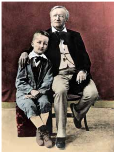
Wagner und sein Sohn Siegfried, um 1880 fotografiert in Neapel.