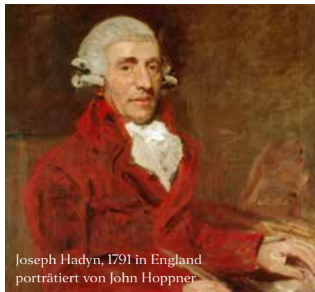
Joseph Haydn, 1791 in England porträtiert von John Hoppner

Die Anregung und einen englischen Ursprungstext für Die Schöpfung brachte Joseph Haydn in den 1790er Jahren von seinen Englandreisen mit, wo er als nunmehr selbständiger Komponist gefeiert wurde. Er lernte dort Handels Oratorien kennen, vor allem den „Messiah“, und