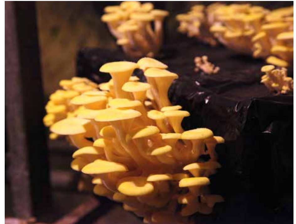
Mit Chaos hat das nichts zu tun: die Schönheit wilden Wucherns im Musée du Champignon in Saumur.

Leben gibt es an diesem ersten Tag der Schöpfungsgeschichte zwar noch nicht, jedoch dringt etwas Vertrautes ans Ohr: die menschliche Stimme. Und sie gehört weder Eva noch Adam, sondern den Erzengeln Raphael, Uriel und Gabriel. Haydn führt sie als Erzählinstanzen ein, sie tragen die Schöpfungsgeschichte aus dem Ersten Buch Mose vor. Das macht sein Oratorium allerdings noch lange nicht zu einer nach Weirauch duftenden, paradisischen Jenseits-Fantasie, die nur für fromme Ohren bestimmt ist. Haydn will es vielmehr als Bekenntnis zum Diesseits verstanden wissen, als Schlüssel zu einer guten Welt, die das Schlechte hinter sich lässt. Wenn er